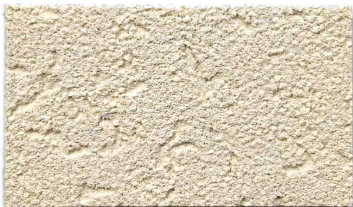
(1,0 mm) Textura Fina | Textura Fina Fine Texture | Texture Fine