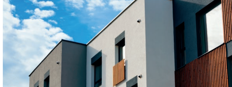
(0,8 mm) Textura Extra Fina | Textura Extra Fina Extra Fine Texture | Texture Extra Fine